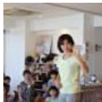
親子みんなで「手遊び」