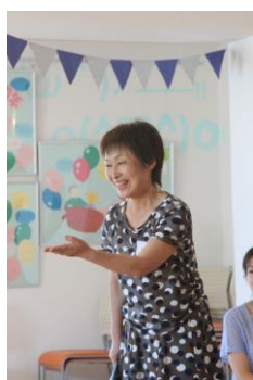
講話「おっぱいっていいね。いつまであげるの？」