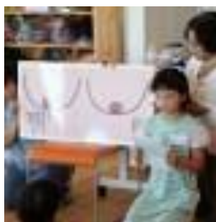
子どもスタッフ 3年生のお姉ちゃんが「おっぱい」の絵本読み聞かせ