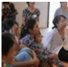
みなさん熱心に耳を傾けて。グループワークは積極的に育児談話。